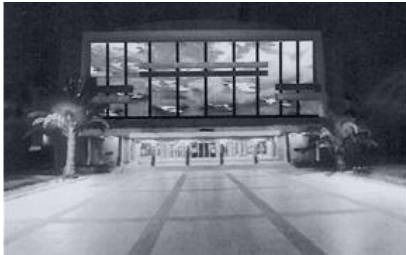
Théâtre national Mohamed V « Ambiance Marine » Peinture-installation (400m 2 ) Rabat.